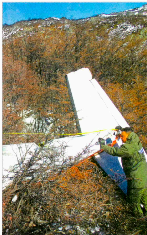
Algunas tragedias aéreas han demorado años en ser localizadas, como la ocurrida con la avioneta Piper extraviada desde Cochran en 1997, y que fue detectada recién en octubre del año pasado.

US$ 5 millones es el costo de implementación de este sistema.