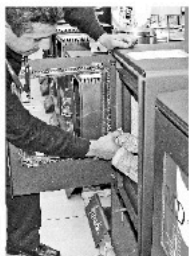
Se mostrarán modelos de estufas.

La actividad se realizará en el frontis de la Gobernación de Ñuble, los días jueves 19 de mayo (de 11.00 a 19.00 horas) y el viernes 20 de mayo (de 10.00 a 14.00 horas).