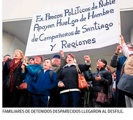
FAMILIARES DE DETENIDOS DESAPARECIDOS LLEGARON AL DESFILE.

EL AERÓDROMO SE UBICA A SEIS KILÓMETROS DEL CENTRO DE CHILLÁN.